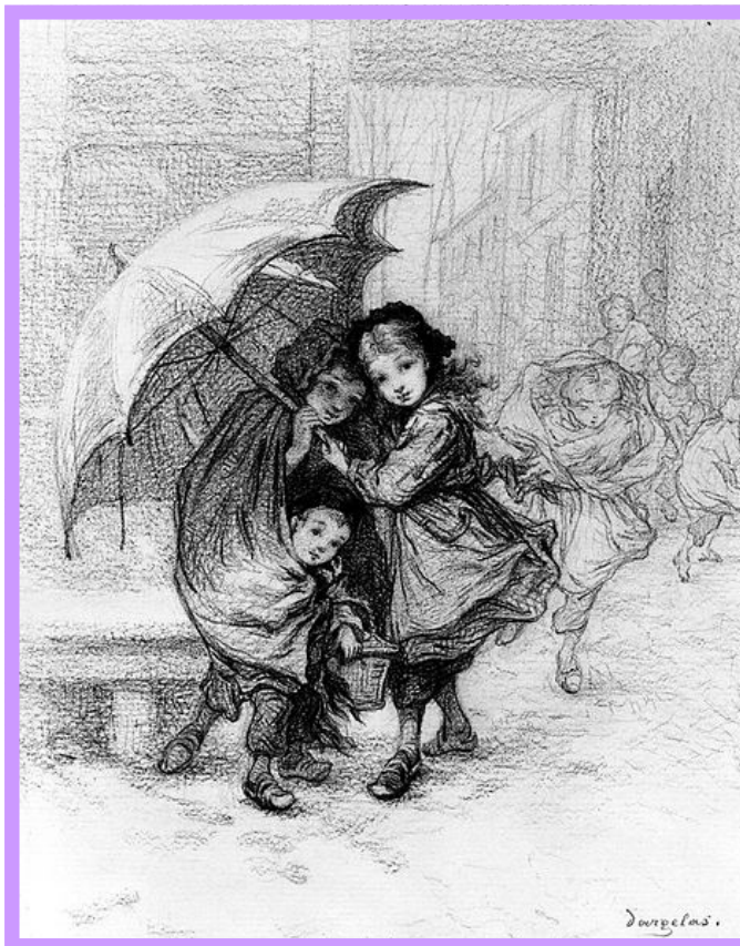
André -Henri Dargelas, Scolari in una tempesta , Walters Art Museum Creative Commons 3.0

Che cosa è e cosa non è l'innovazione didattica, se la finalità è realizzare una scuola più motivante e significativa per tutti?