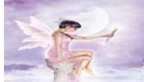
La fatina vola fra le nuvole, illumina il cielo e lo cosparge di stelline profumate.