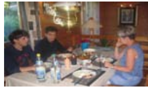
La mamma ha preparato un bel pranzetto per me e mio fratello, ma noi avevamo già mangiato.

Ricerca negli enunciati /periodo, che accompagnano ogni foto, le parole che creano una relazione di parità o di dipendenza (legame di coordinazione o di subordinazione).